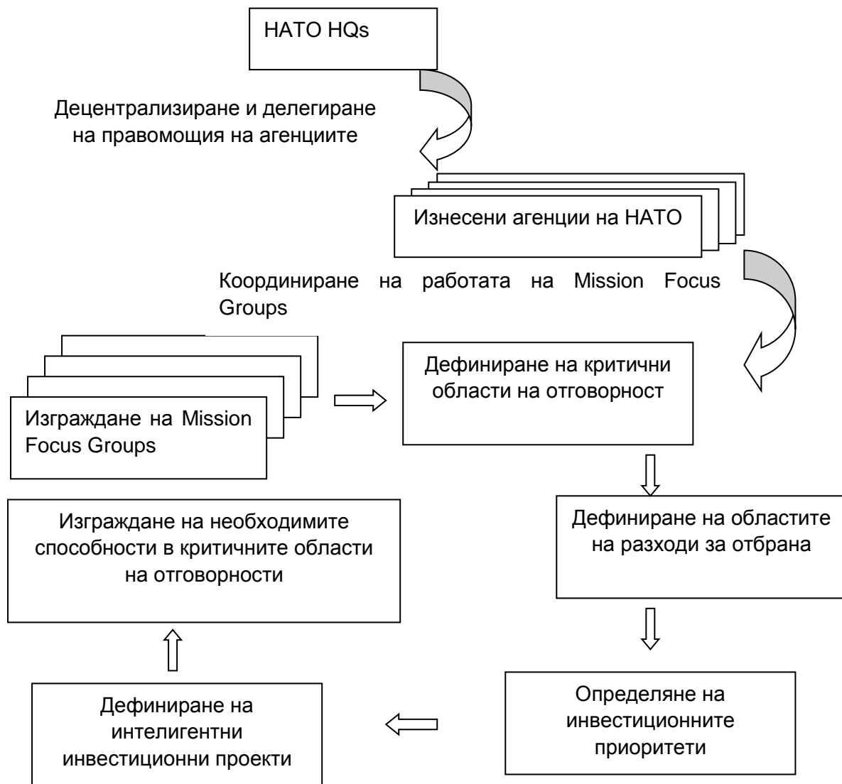
Фиг. 1. Модел за координиране на дейността на MFGs

Функционирането на всяка една от тези групи ще изисква ефективно ръководство (като пример от страна-членка лидер), а като цяло всичките групи ще имат потребност от ефективно координиране от страна на НАТО или на (изнесени) агенции на Алианса, което ще позволи последните да бъдат по-близо до групите, а от там като следствие и по-полезни в процеса на координиране. Примерен модел на съдържанието на дейността на т.нар. Mission Focused Groups и ролята на НАТО при координиране на тяхната дейност е представен на фигура 1.